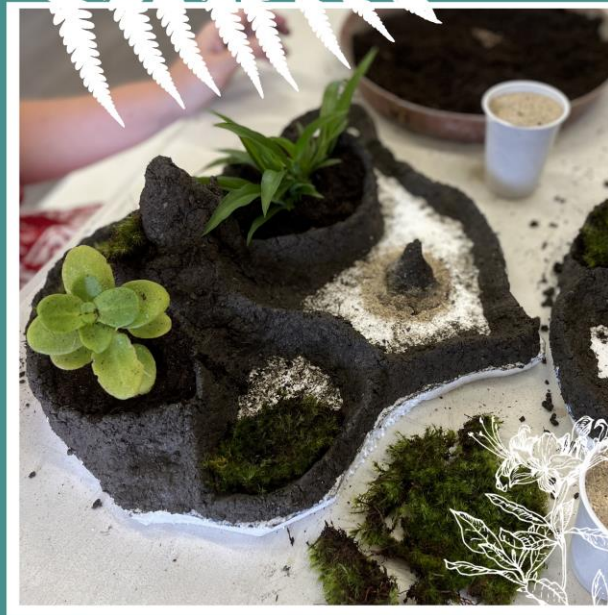
Bonkei en vidéo

Nos artisans et animateurs vous accompagneront dans cette découverte et transmission de notre savoir faire.