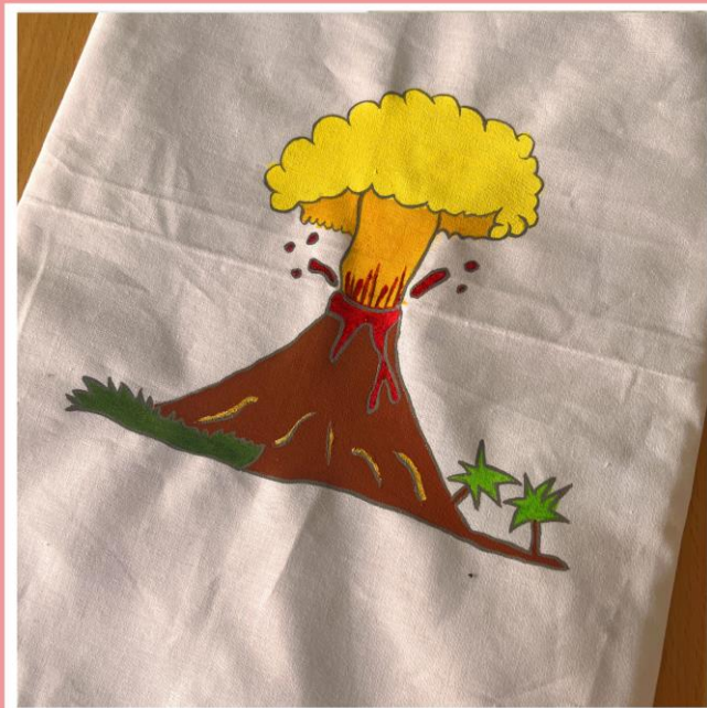
Peinture sur tissu en vidéo